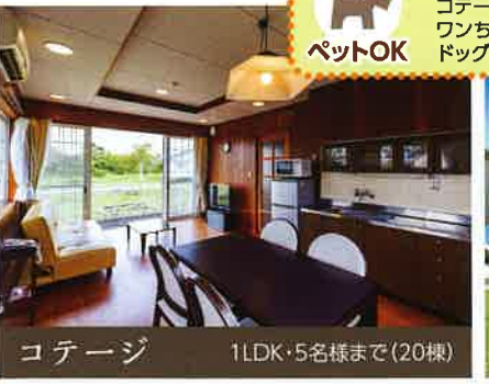
コテージ 1LDK・5名様まで(20棟)

ワンちゃんと一緒に泊まれる！ ペットOK コテージ20棟のうち11棟は、ワンちゃんと一緒に泊まります。ドッグランもご用意！