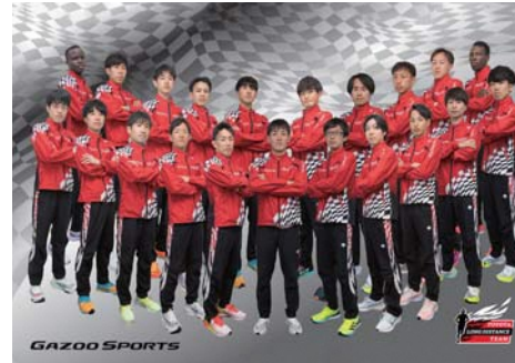
トヨタ自動車(愛知県田原市)