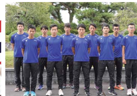
御殿場滝ヶ原自衛隊(静岡県御殿場市)