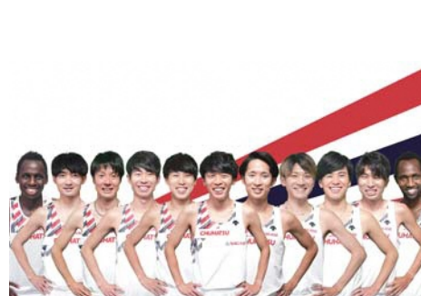
中央発條(愛知県名古屋市)