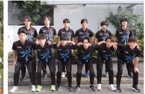
トーエネック(愛知県名古屋市)