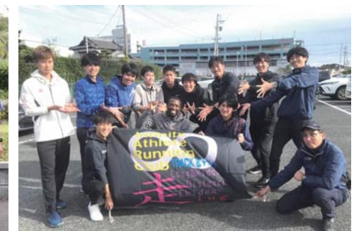
Infinity Athlete & Running Club(愛知県刈谷市)