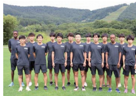
愛知製鋼(愛知県東海市)