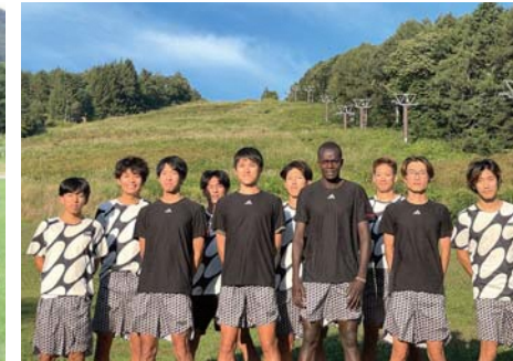
愛三工業(愛知県大府市)