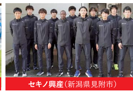
セキノ興産(新潟県見附市)