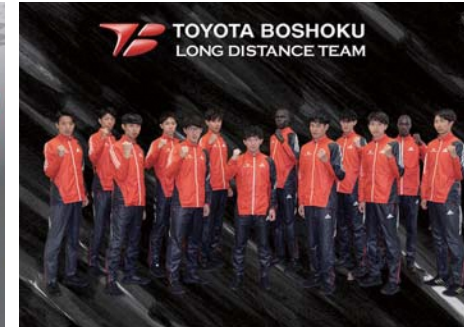
トヨタ紡織(愛知県刈谷市)