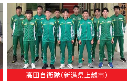
高田自衛隊(新潟県上越市)